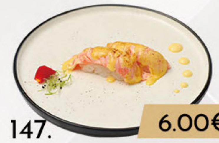
147. 6.00€ NIGIRI FLAMEADO CON CARAMELO (4U)