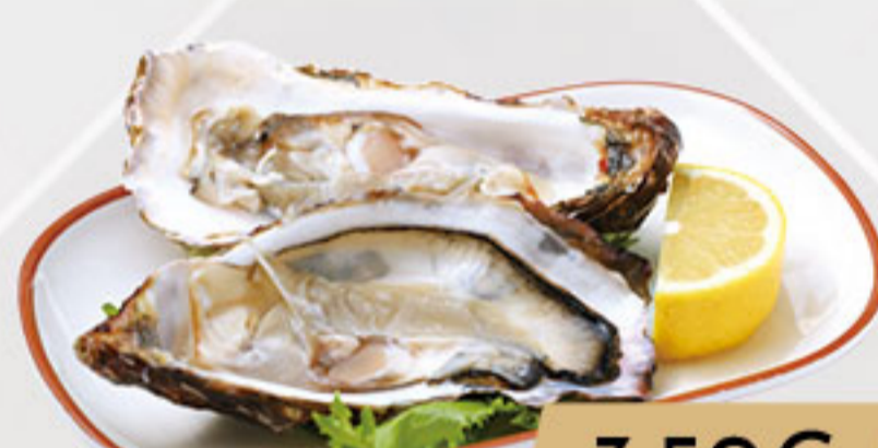
12. 3.50€ OSTRA (1U)