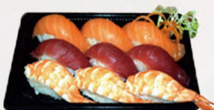
Bento 7 (9U) 14.00€