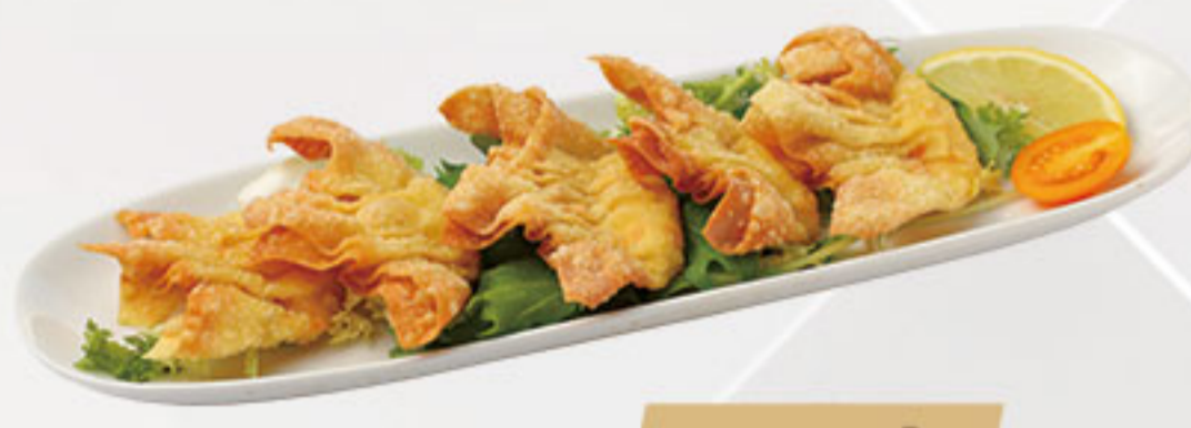
25. 3.50€ WANTUN FRITO (4U)