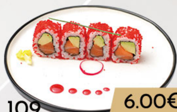
109. 6.00€ RED BIKOROLL (8U)