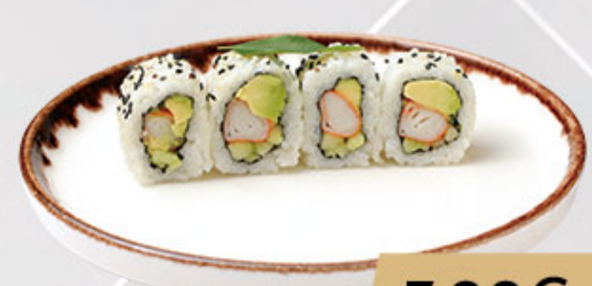
123. 7.00€ KOBE ROLL (8U)