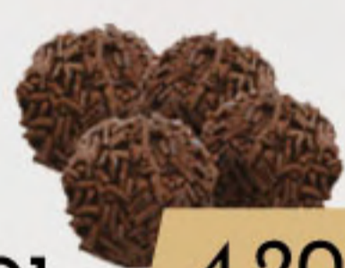
PO1. 4.20€ TRUFAS *(4UNI)