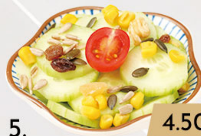
5. 4.50€ ENSALADA DE PEPINO