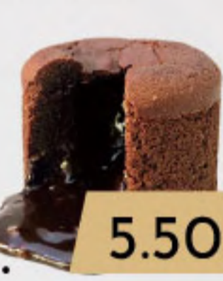
PO9. 5.50€ SOUFFLE DE CHOCOLATE