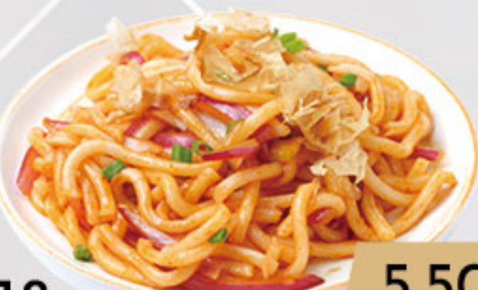
18. 5.50€ YAKI UDON