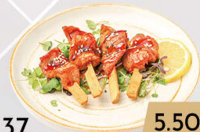
37. 5.50€ PINCHOS DE SECRETO IBÉRICO