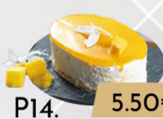
PO14. 5.50€ COCO Y MANGO TENTACIÓN HELADA