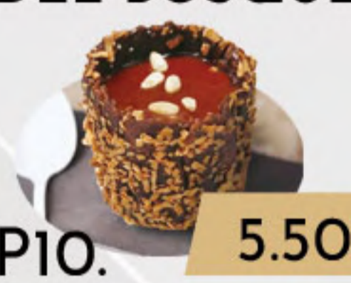
PO10. 5.50€ CREMA CATALANA Y PINONES