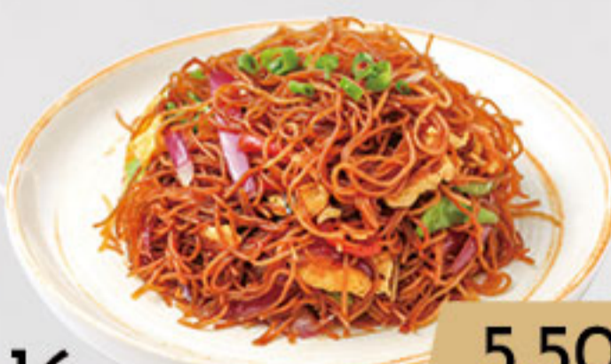
16. 5.50€ FIDEOS DE ARROZ