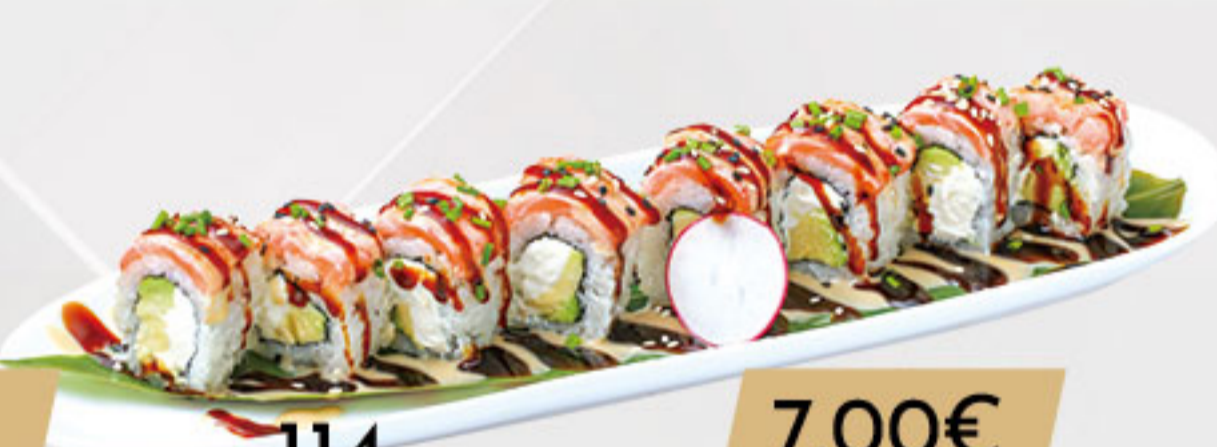
114. 7.00€ CATERPIE ROLL (8U)