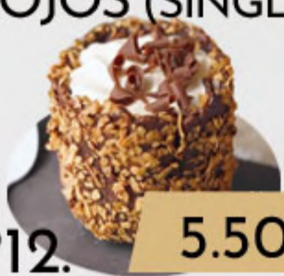
PO12. 5.50€ BAILEYS