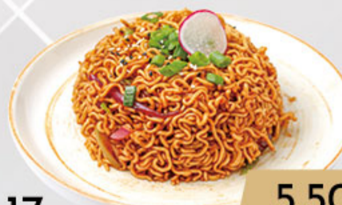
17. 5.50€ YAKISOBA