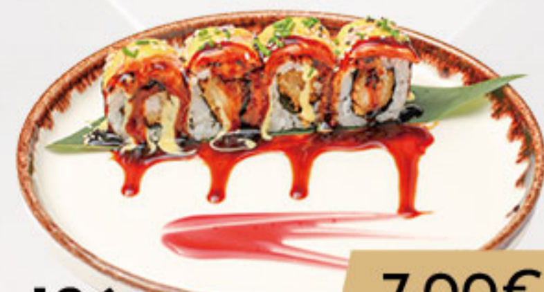
126. 7.00€ AMA EBI ROLL (8U)