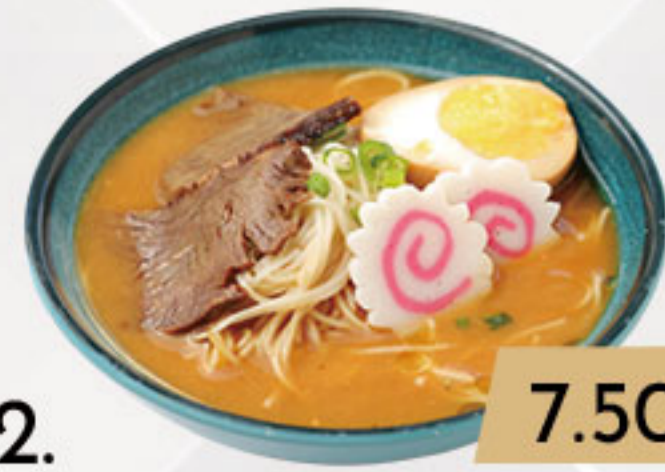
2. 7.50€ RAMEN