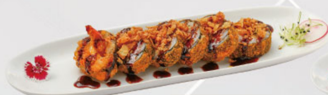
141. 8.00€ HOT FURAI TEMPURA (6U)