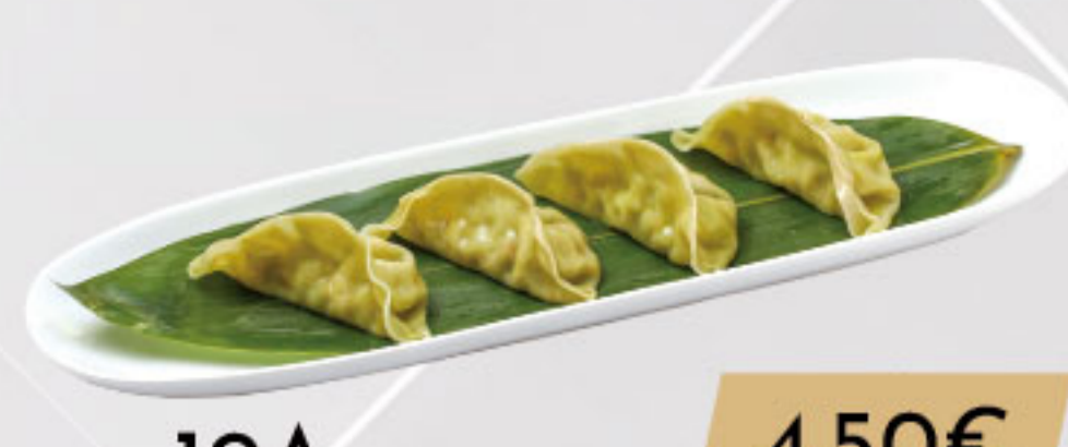
19A. 4.50€ GYOZA VEGETAL (4U)