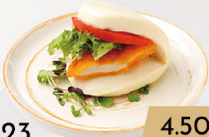
23. 4.50€ BAO DE POLLO