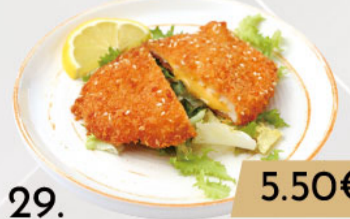
29. 5.50€ TONKATSU