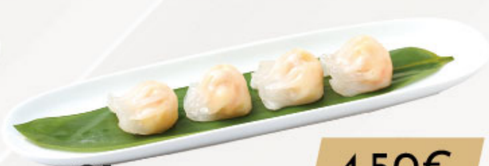
21. 4.50€ GYOZA DE LANGOSTINO (4U)