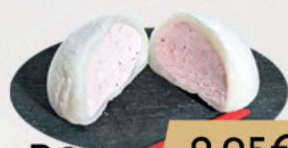
PO4. 2.95€ MINI MOCHI (1UNI)