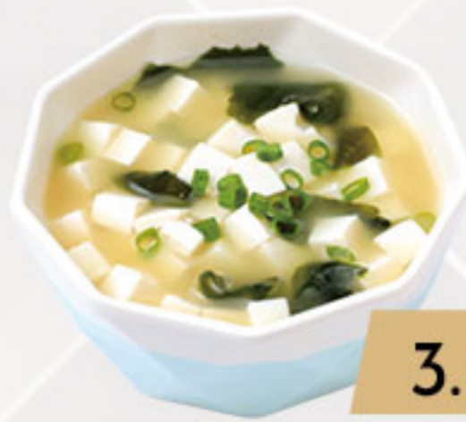
1. 3.50€ SOPA DE MISO