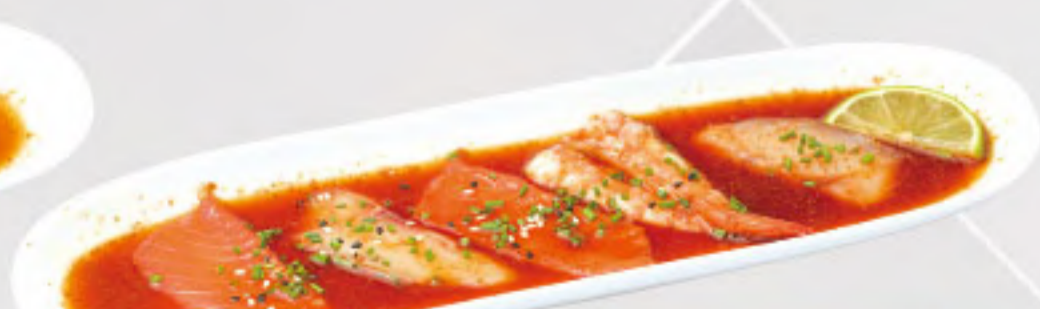
168. 5.00€ TRISHIMI (5U)