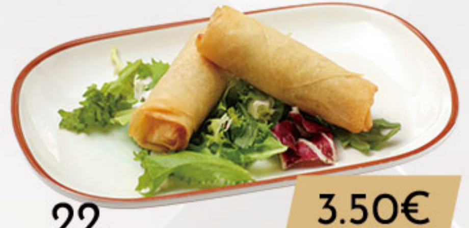
22. 3.50€ HARUMAKI (2U)