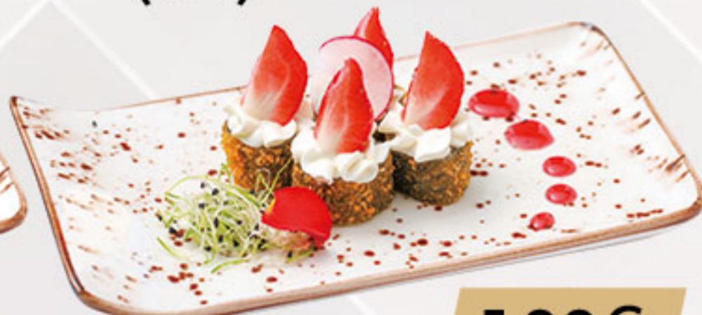
106. 5.00€ STRAW MAKI FRITO CHEESE (8U)