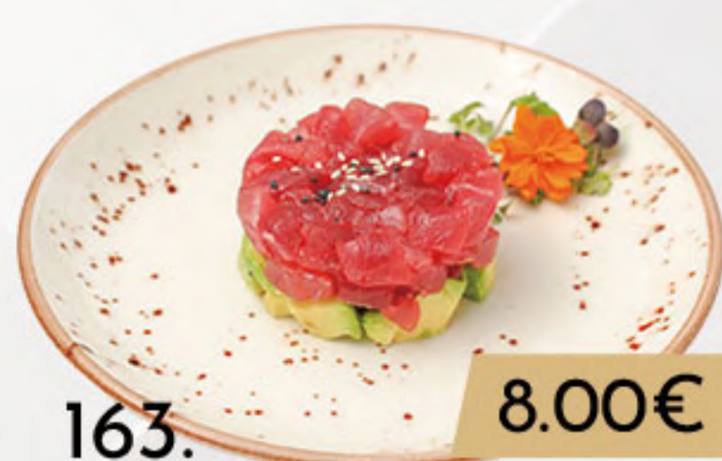
163. 8.00€ TARTAR DE ATÚN