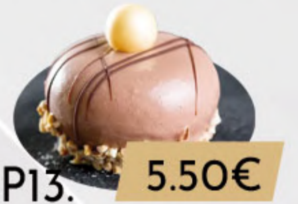
PO13. 5.50€ PORCIÓN REDONDA DULCE DE LECHE