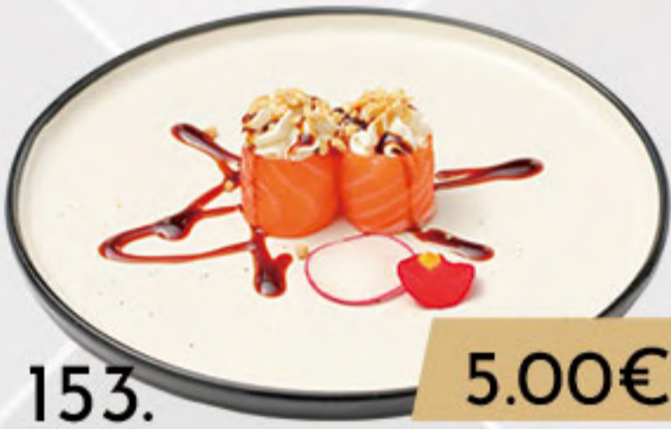
153. 5.00€ GUNKAN SALMÓN CHEESE (2U)