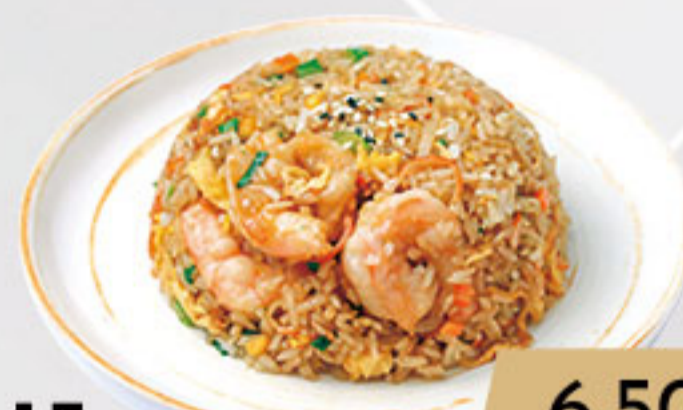
15. 6.50€ ARROZ CON MARISCOS