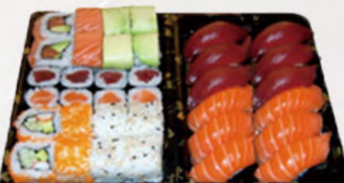
Bento 8 (36U) 37.00€