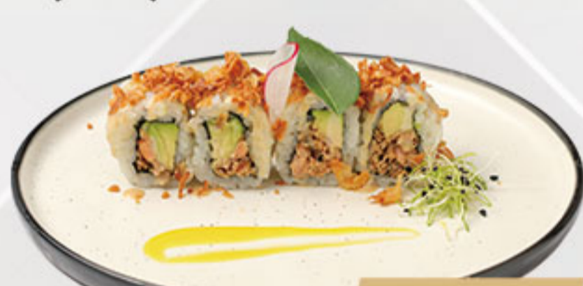
137. 7.00€ DREAM ROLL (8U)