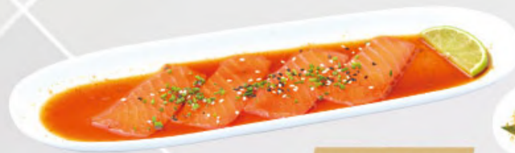
155. 5.00€ SAKE PONZU (5U)