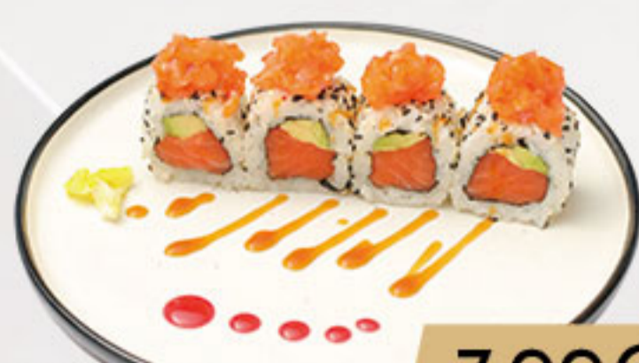
128. 7.00€ URA ROLL (8U)