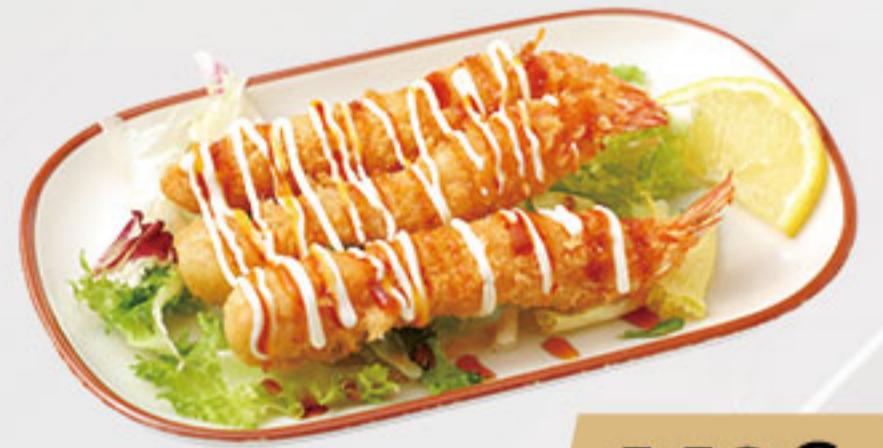
32. 5.50€ TEMPURA LANGOSTINO (3U)