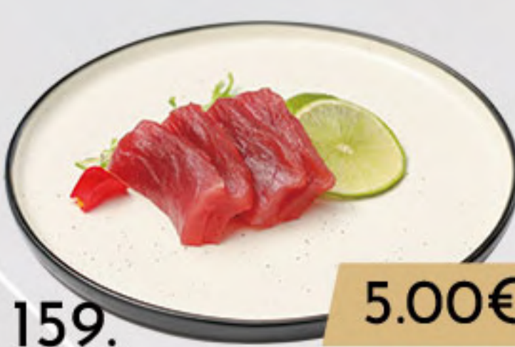
159. 5.00€ SASHIMI DE ATÚN (4U)