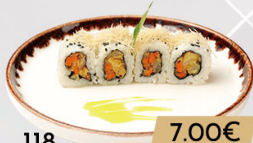
118. 7.00€ URA TEMPURA VEGETAL (8U)