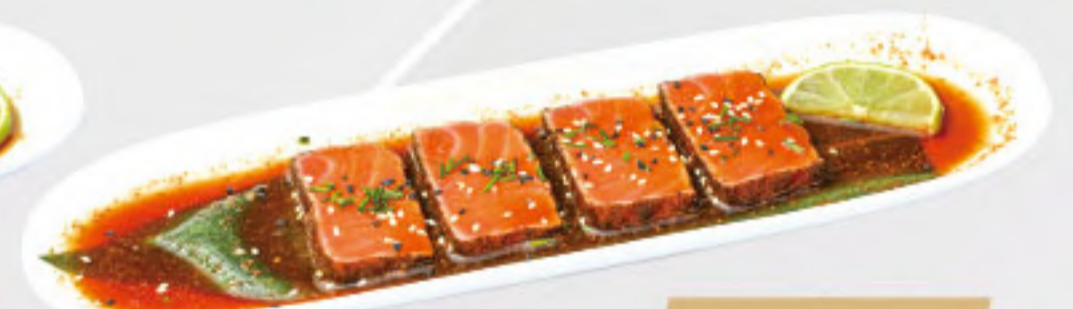
156. 5.00€ SAKE TATAKI (4U)