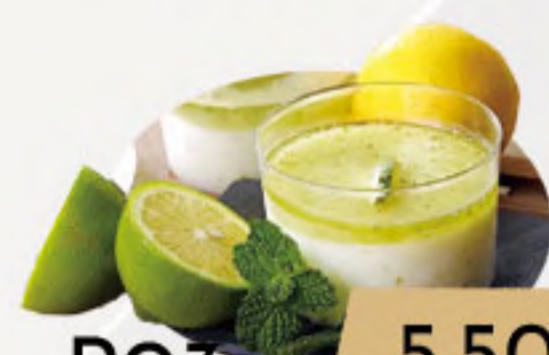
PO3. 5.50€ MOJITO HELADO