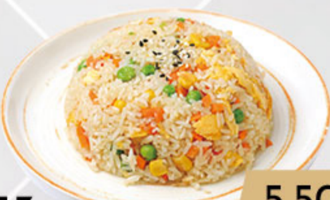
13. 5.50€ ARROZ DE LA CASA