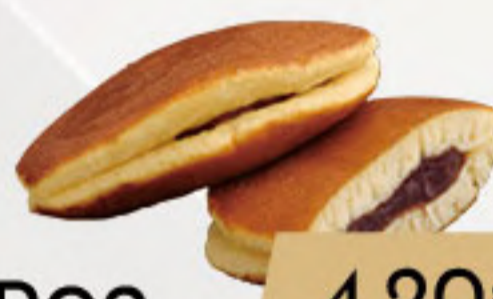
PO2. 4.20€ DORAYAKIS CHOCOLATE *(1UNI)