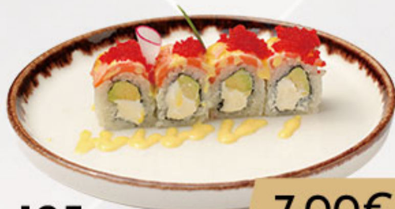
125. 7.00€ MARTE ROLL (8U)