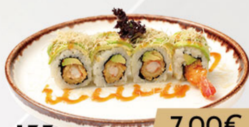
133. 7.00€ DRAGÓN DORADO (8U)