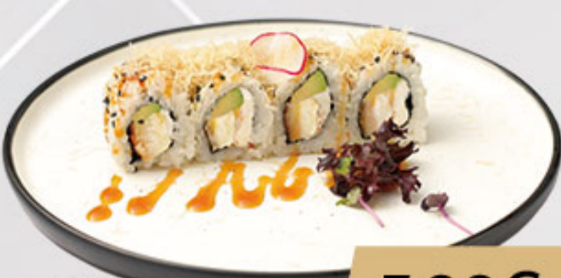
121. 7.00€ CRISPY CHICKEN ROLL (8U)