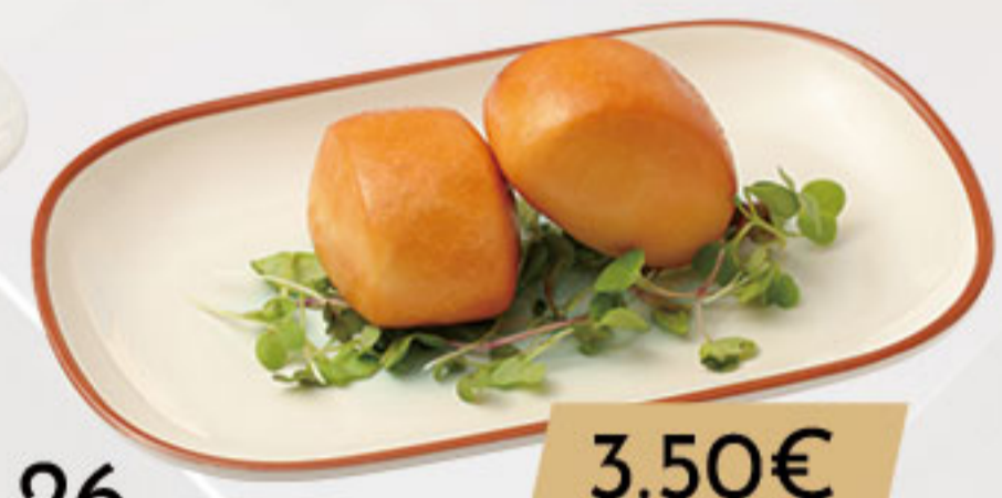
26. 3.50€ PANECITOS (2U)