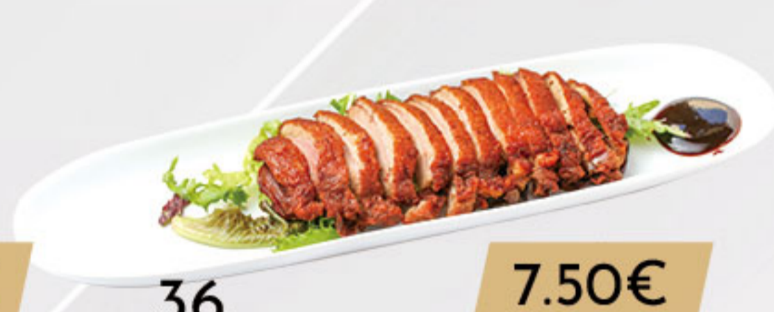
36. 7.50€ PATO AL ESTILO JAPONÉS