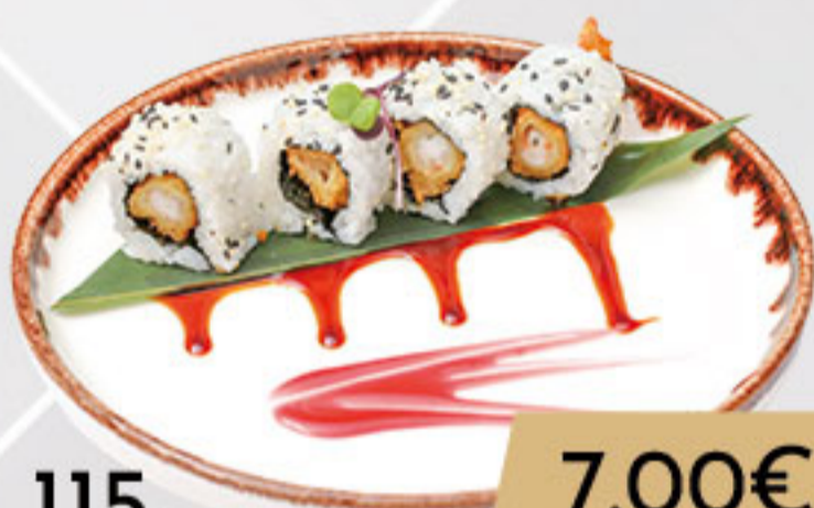
115. 7.00€ URAMAKI LANGOSTINO (8U)