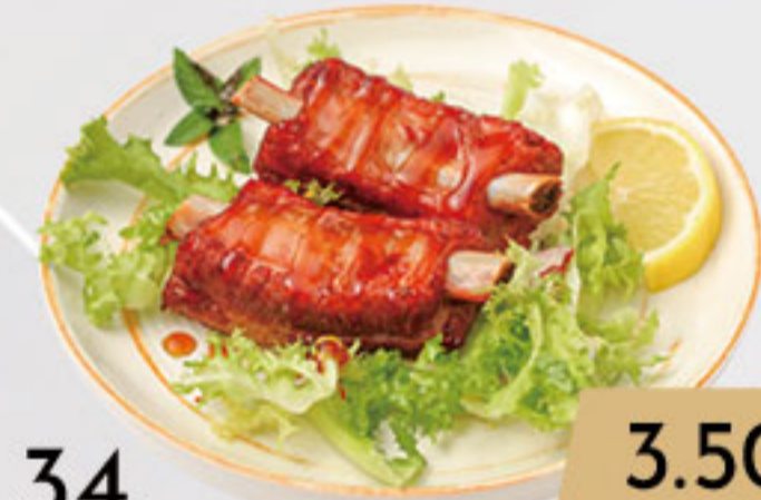
34. 3.50€ COSTILLAS AL ESTILO JAPONÉS (2U)