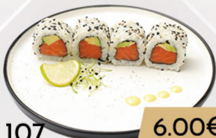
107. 6.00€ URAMAKI ORIGINAL (8U)