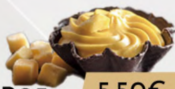
PO5. 5.50€ FLOR MANGO SORBETE