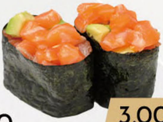
150. 3.00€ SAKE GUNKAN (2U)