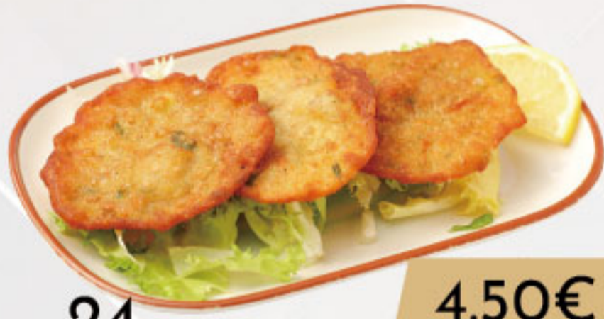
24. 4.50€ TORTILLAS DE GAMBAS(3U)