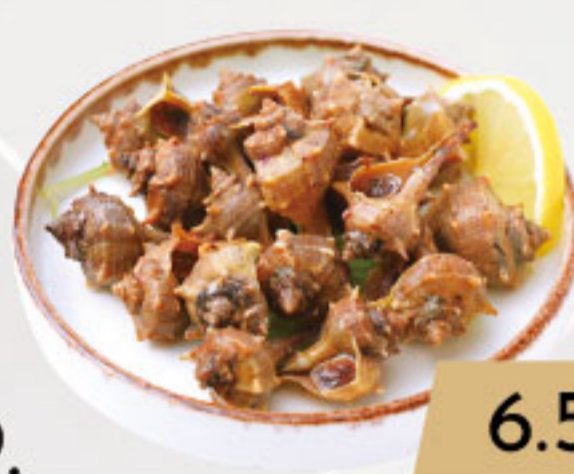
9. 6.50€ CAÑAILLAS COCIDAS