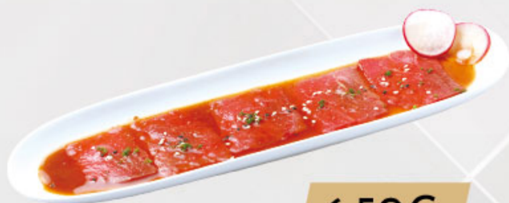
11. 6.50€ CARPACCIO DE TERNERA