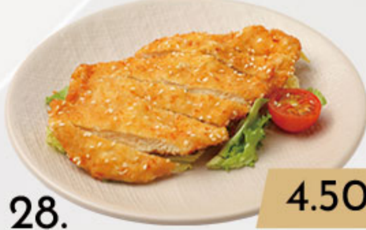
28. 4.50€ TORIKATSU