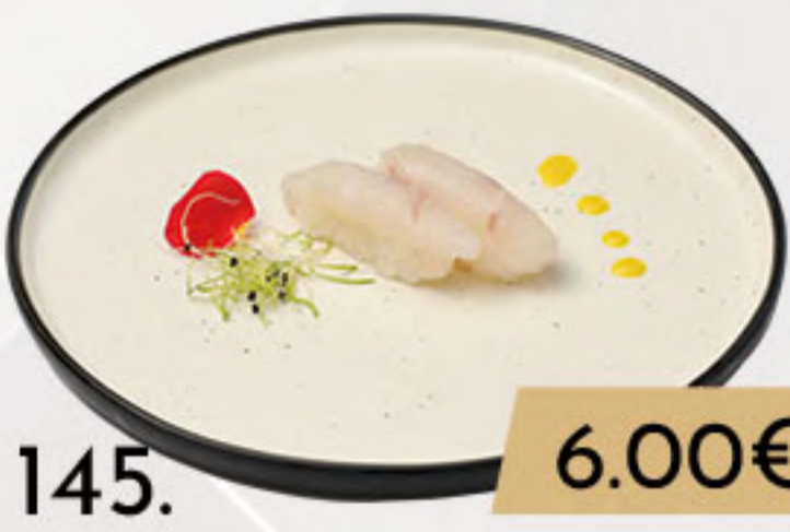
145. 6.00€ NIGIRI PEZ LUBINA (4U)