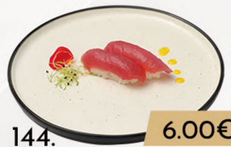
144. 6.00€ NIGIRI ATÚN (4U)