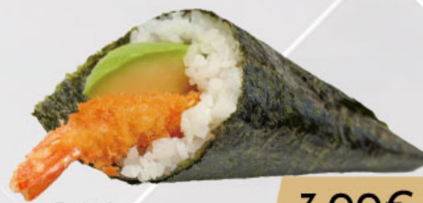
166. 3.00€ TEMAKI LANGOSTINO (1U)