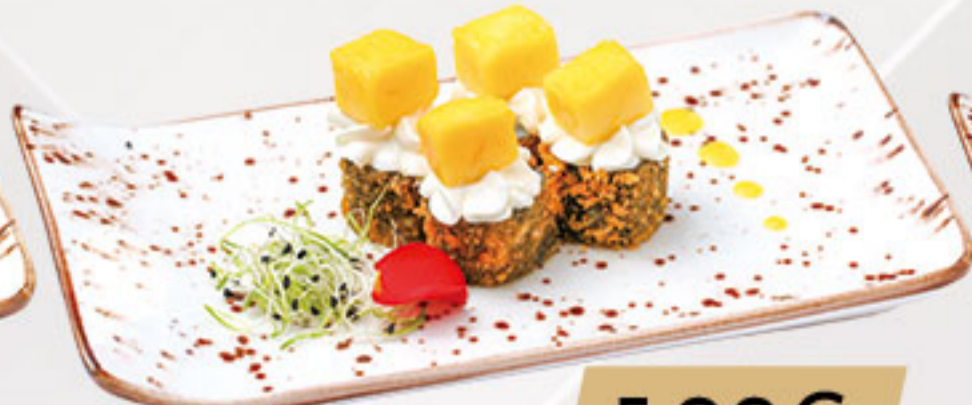
105. 5.00€ MANGO MAKI FRITO CHEESE (8U)