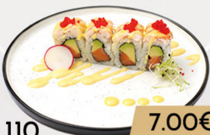
110. 7.00€ LLAMA ROJA ROLL (8U)