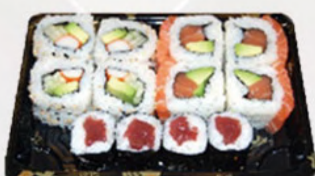
Bento 6 (12U) 10.50€