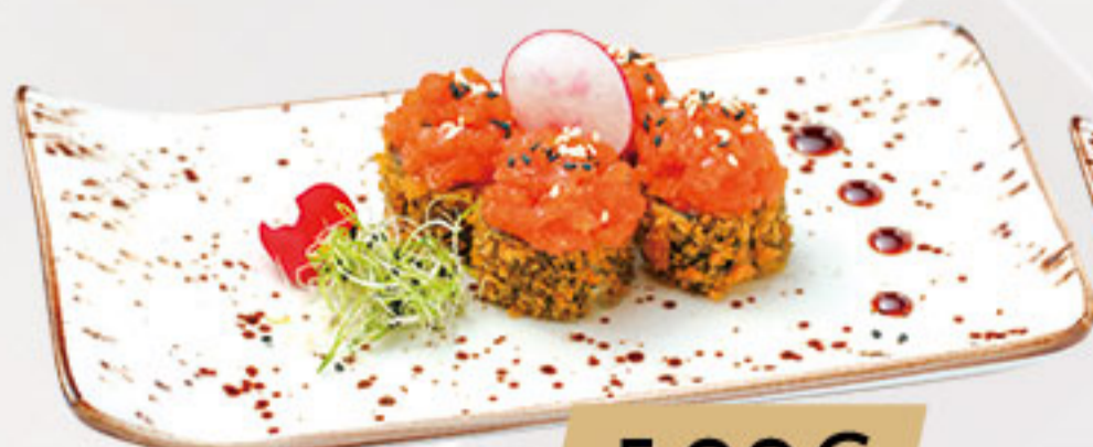
104. 5.00€ MAKI FRITO CON SALMÓN (8U)