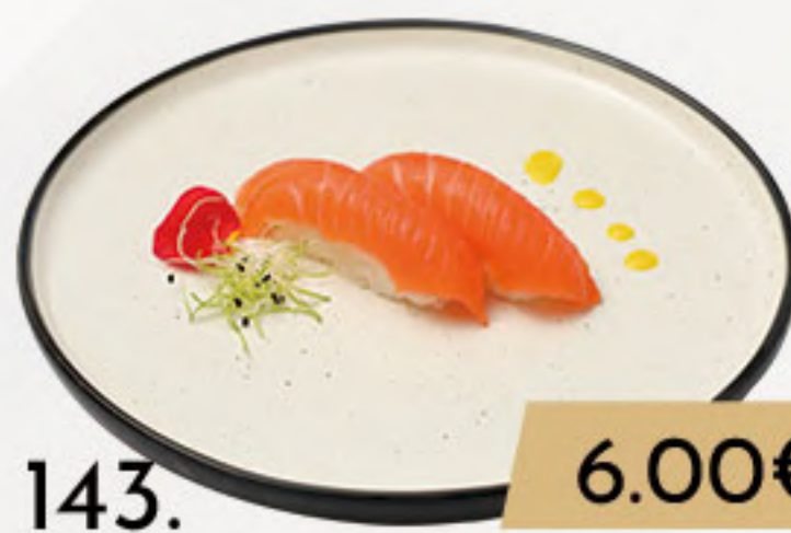
143. 6.00€ NIGIRI SAKE (4U)