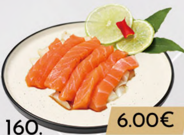
160. 6.00€ TARU SAKE