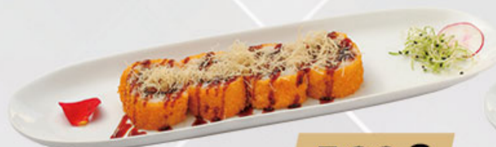
138. 7.00€ IKA ROLL TEMPURA (6U)