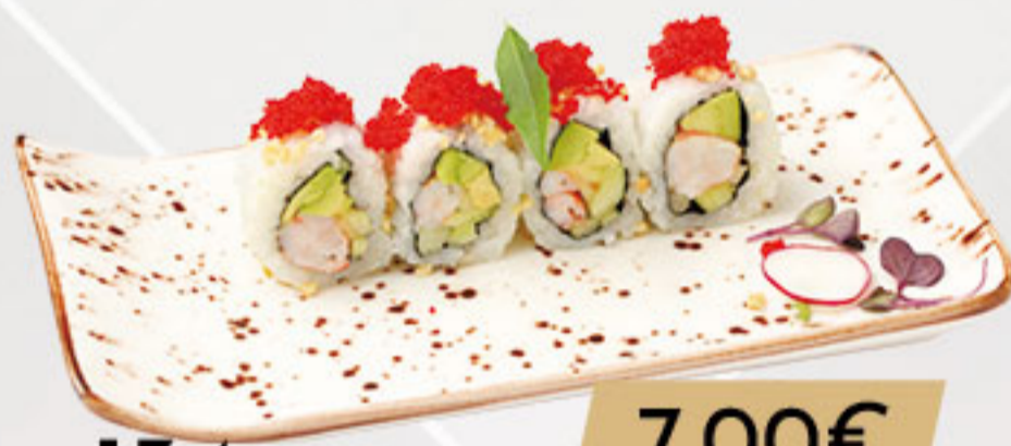
134. 7.00€ ESPECIAL ROLL (8U)