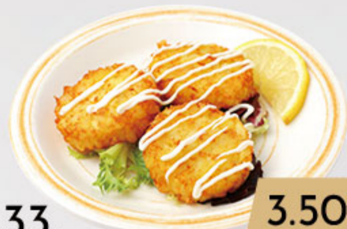
33. 3.50€ NUGGETS DE PATATA Y CEBOLLA (2U)