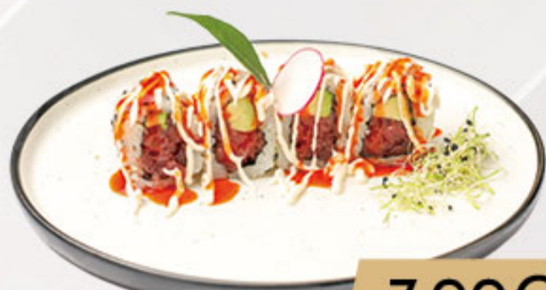
127. 7.00€ TOKYO ROLL (8U)