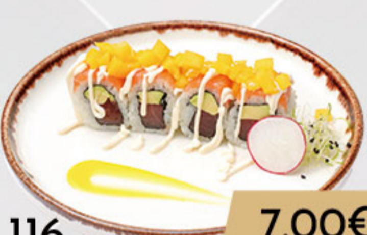
116. 7.00€ URA MANGO (8U)