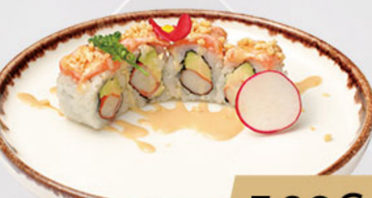
122. 7.00€ NAGOYA ROLL (8U)