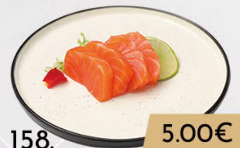
158. 5.00€ SASHIMI DE SALMÓN (4U)