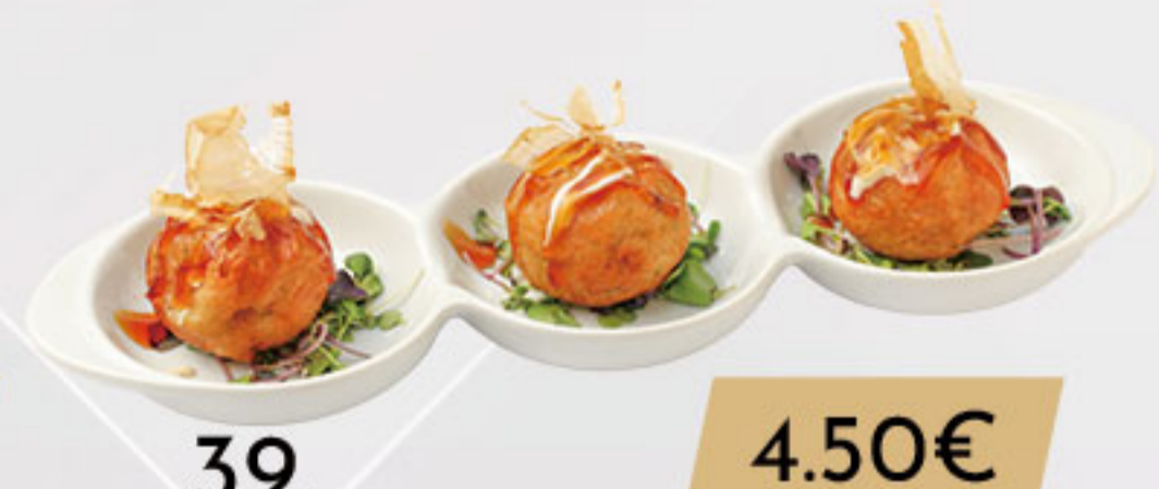
39. 4.50€ TAKOYAKI (3U)