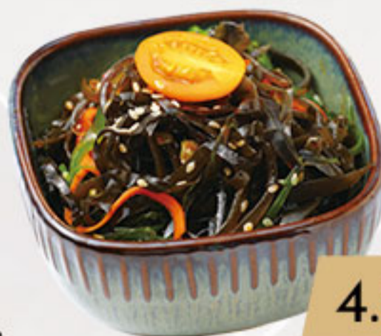
4. 4.50€ ALGAS DE LA CASA