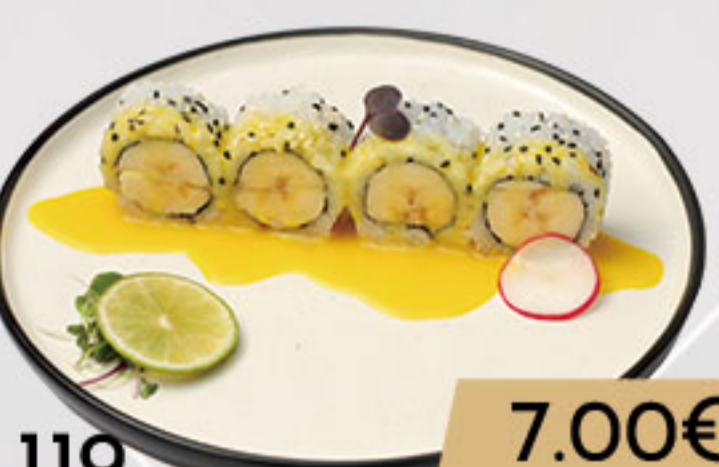
119. 7.00€ URAMAKI PLÁTANO (8U)