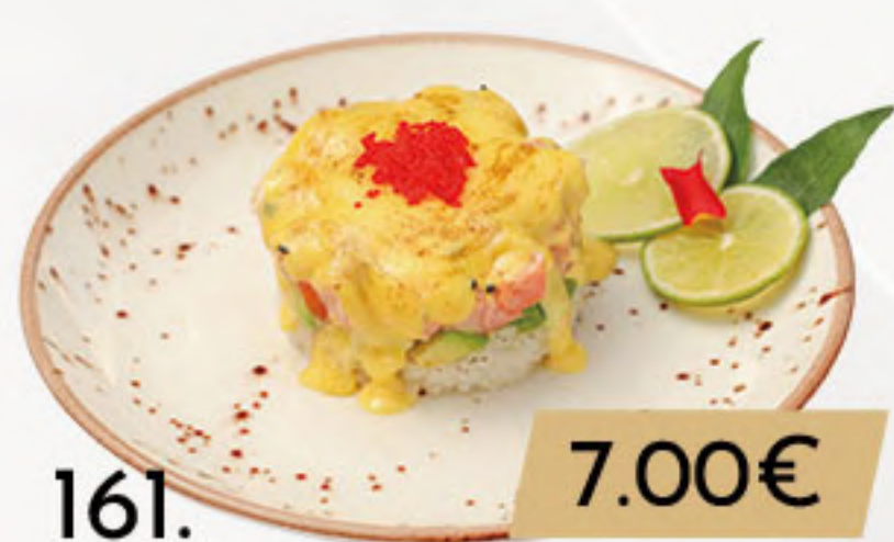
161. 7.00€ TARTAR FLAMEADO