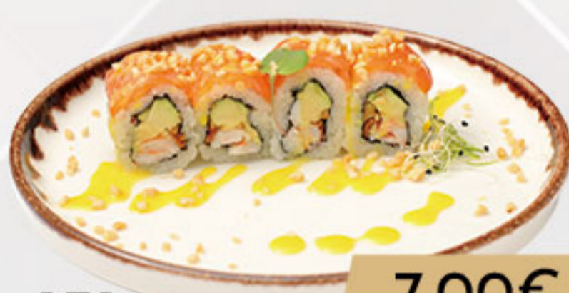
131. 7.00€ TEKKA ROLL (8U)