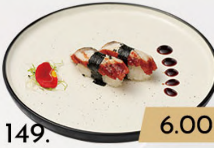
149. 6.00€ NIGIRI UNAGI (4U)