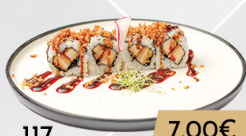
117. 7.00€ URA AJI (8U)