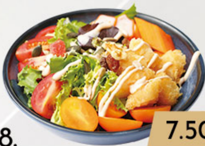
8. 7.50€ ENSALADA DE TEMPURA LANGOSTINOS