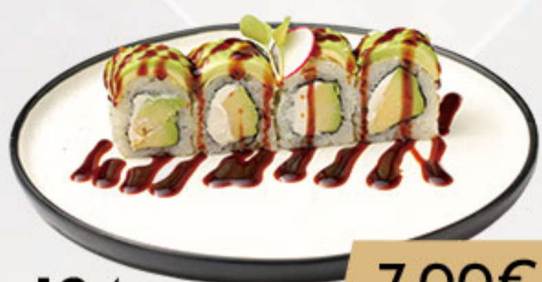
124. 7.00€ KISS ROLL (8U)