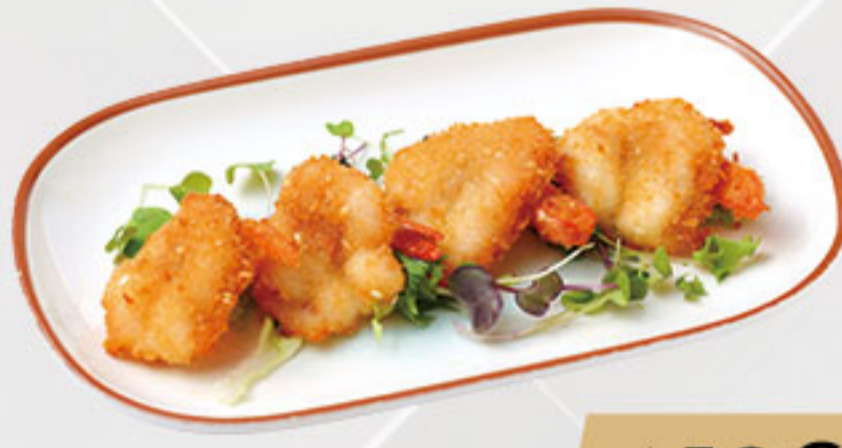
31. 4.50€ LANGOSTINOS EN KIMONO (4U)