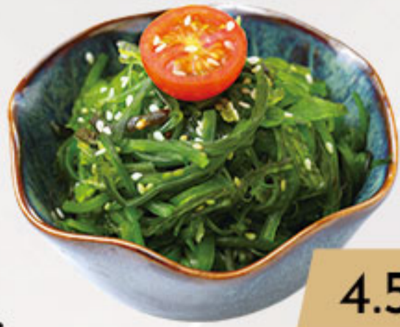
3. 4.50€ ALGAS WAKAME