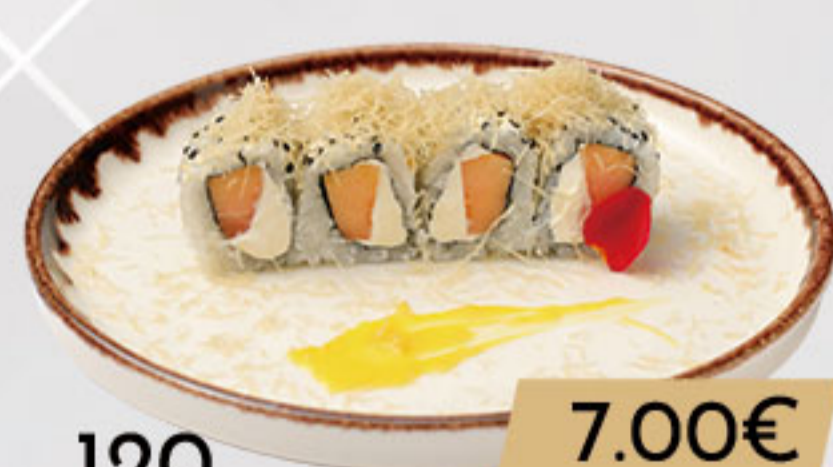
120. 7.00€ PAPAYA ROLL (8U)