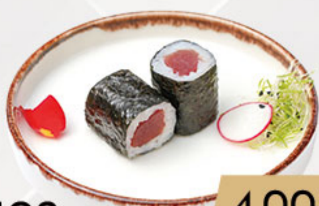
102. 4.00€ MAKI TUNA (8U)