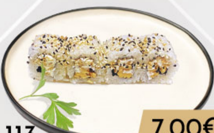
113. 7.00€ URAMAKI NUECES Y QUESO (8U)