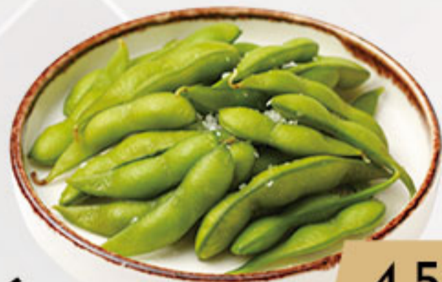
6. 4.50€ EDAMAME