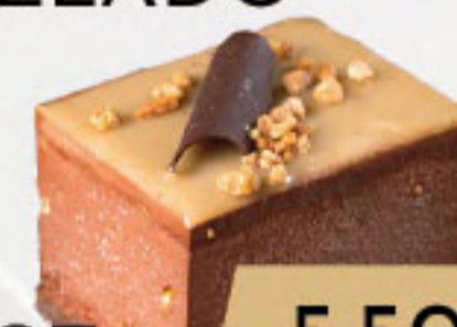
PO7. 5.50€ CHOCOLATE CON CACAHUETES