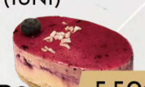
PO6. 5.50€ COCO Y FRUTOS DEL BOSQUE