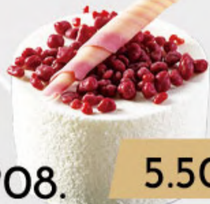
PO8. 5.50€ CHOCOLATE BLANCO Y FRUTOS ROJOS (SINGLUTEN)