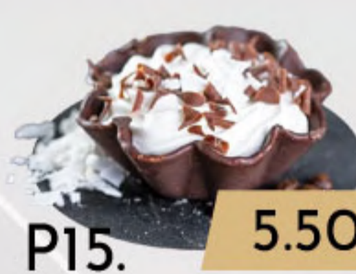
PO15. 5.50€ COCO-LOCO (CAFÉ Y COCO)