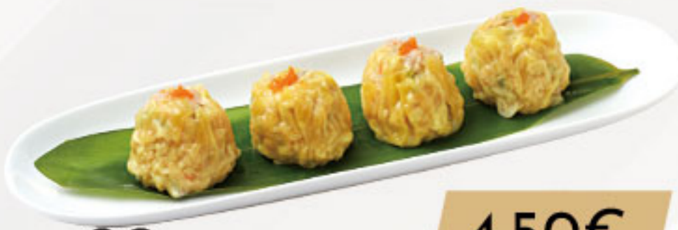
20. 4.50€ SAU MAI (4U)