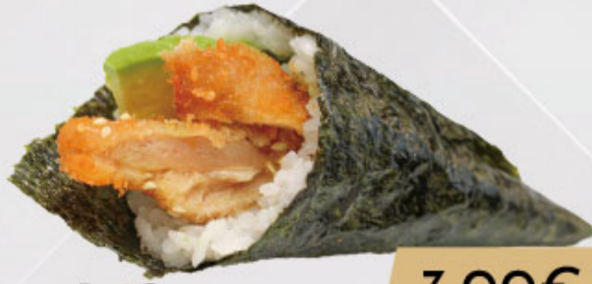
142. 3.00€ TEMAKI POLLO (1U)