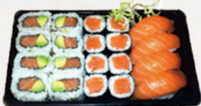
Bento 2 (20U) 17.00€