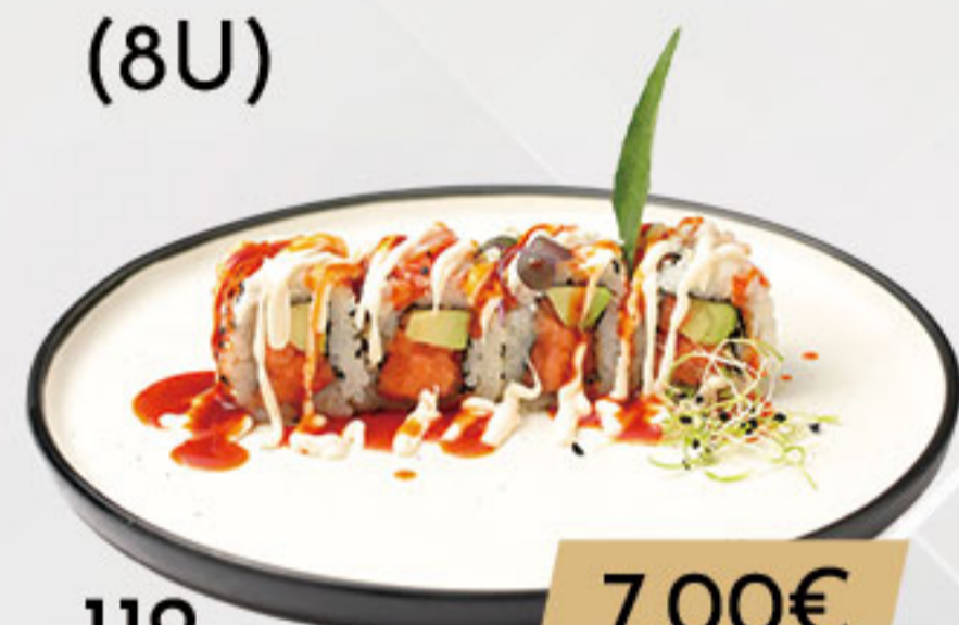
112. 7.00€ MERCURIO ROLL (8U)