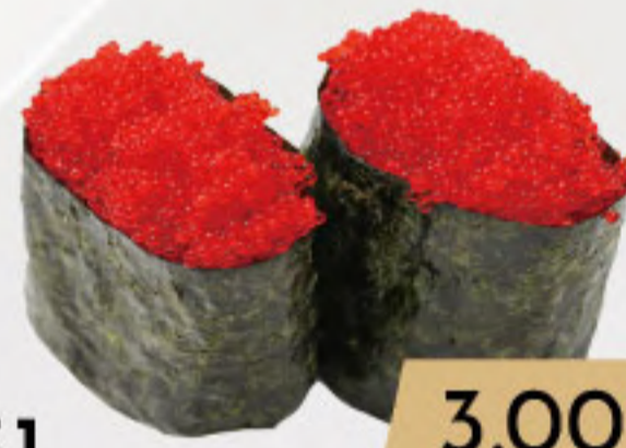
151. 3.00€ GUNKAN RED(2U)