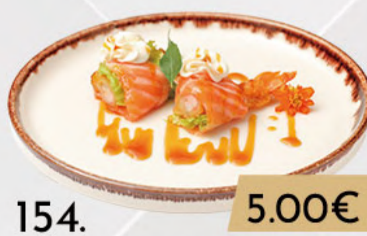
154. 5.00€ GUNKAN TEMPURA LANGOSTINO (2U)