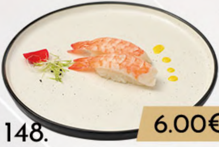
148. 6.00€ NIGIRI LANGOSTINO (4U)