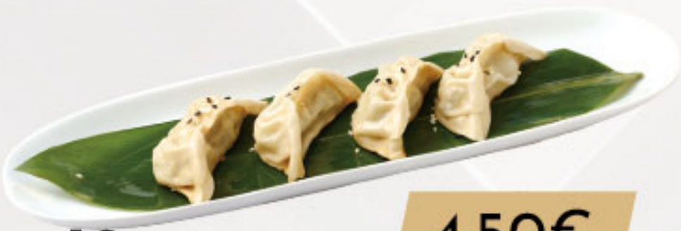
19. 4.50€ GYOZA DE CARNE (4U)