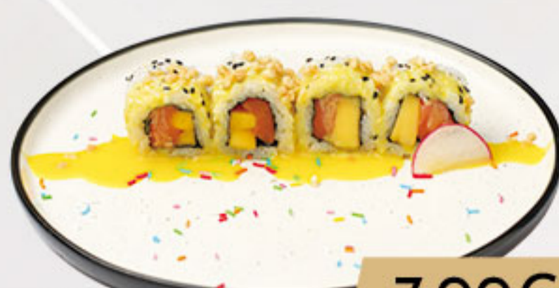
129. 7.00€ INARI ROLL (8U)