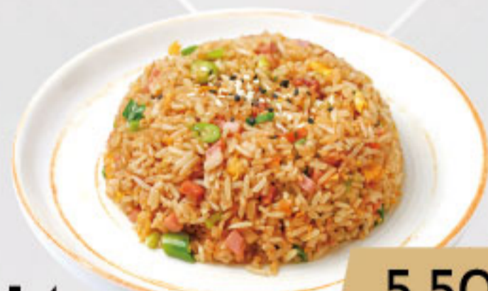
14. 5.50€ ARROZ 5 SABORES