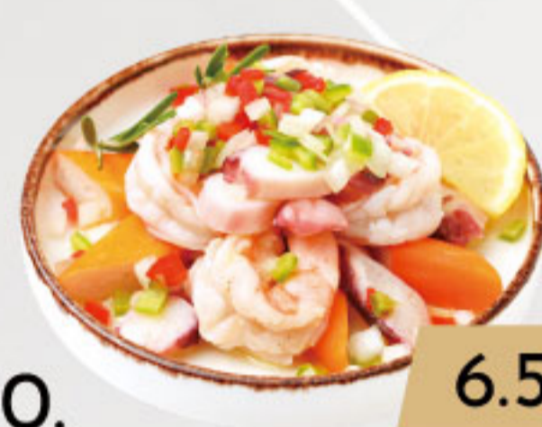
10. 6.50€ ENSALADA DE MARISCOS