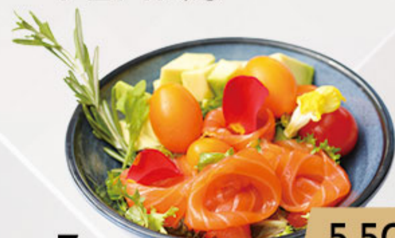
7. 5.50€ ENSALADA DE LA CASA