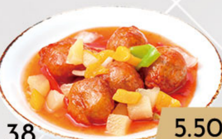
38. 5.50€ CERDO AGRIDULCE (5U)