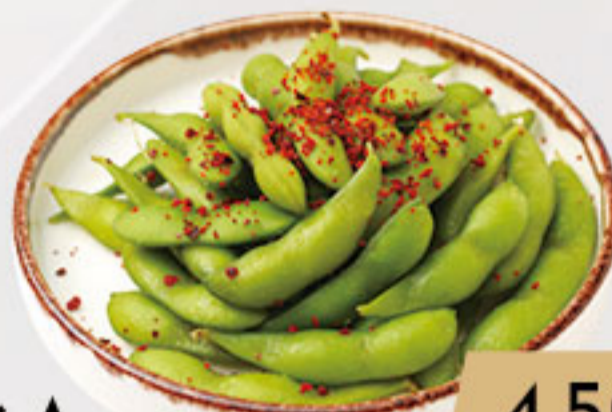
6A. 4.50€ EDAMAME CON PICANTE