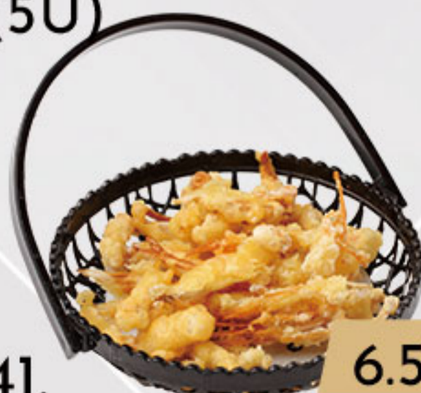
41. 6.50€ TEMPURA DE SETAS VARIADAS