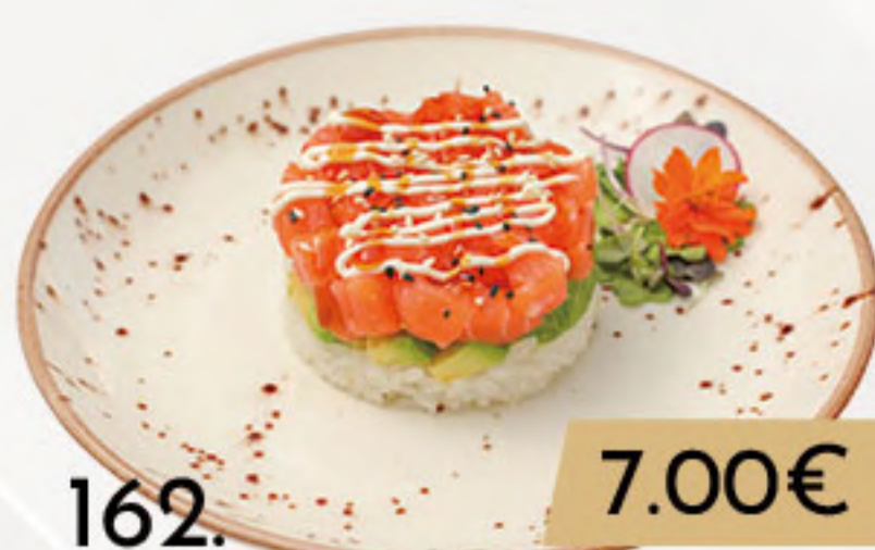
162. 7.00€ TARTAR SAKE