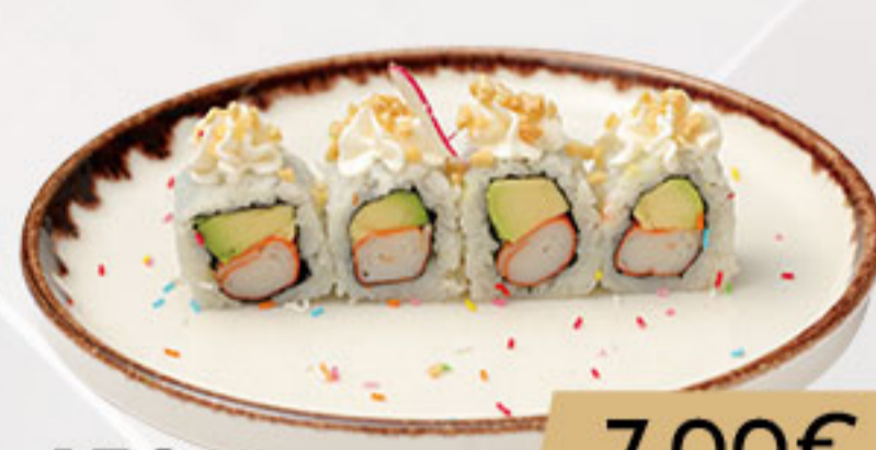
132. 7.00€ GOMA ROLL (8U)