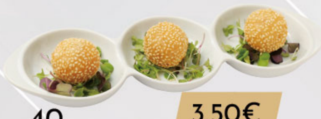
40. 3.50€ BOLAS DE SÉSAMO (3U)