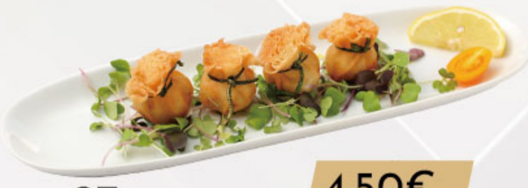
27. 4.50€ ATADITO DE VERDURAS (4U)