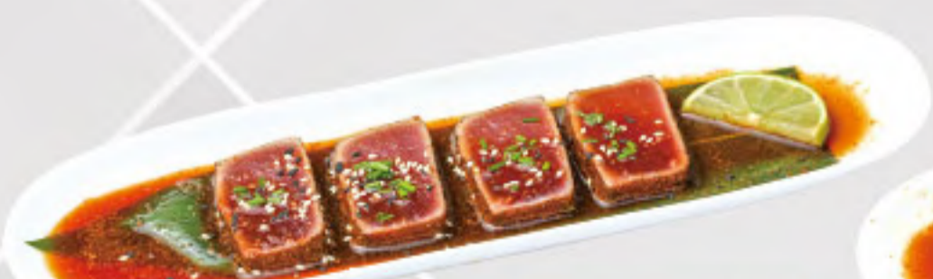
157. 5.00€ TATAKI TUNA (4U)