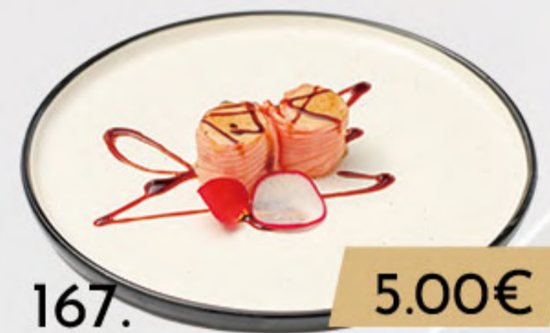
167. 5.00€ GUNKAN SALMON FLANMEADO(2U)