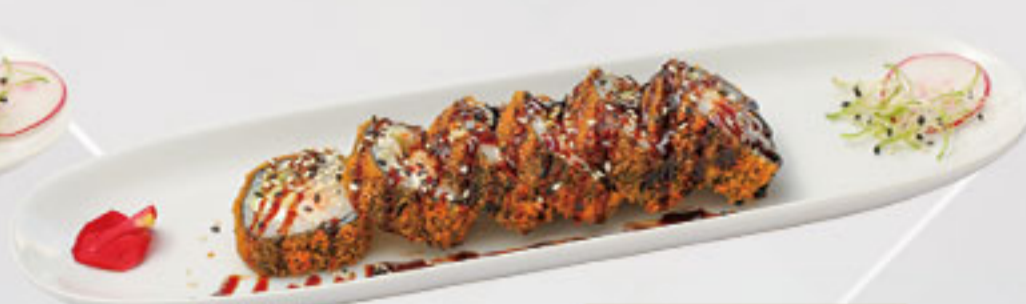
165. 7.00€ CANGREJO TEMPURA (6U)