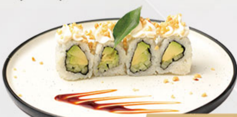
136. 7.00€ VEGETAL ROLL (8U)