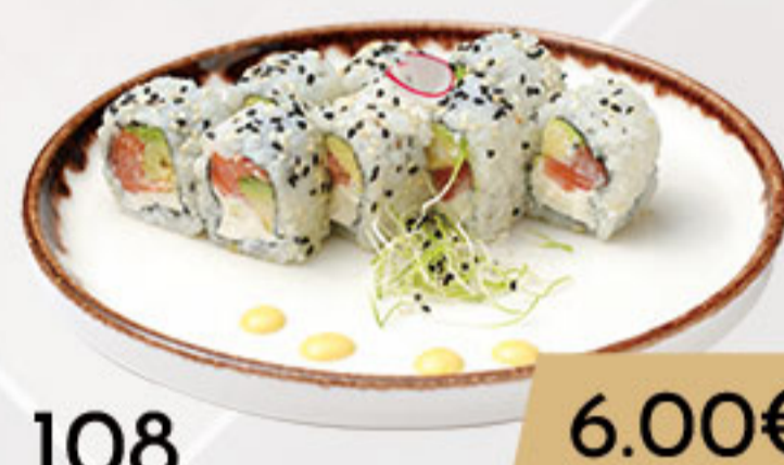
108. 6.00€ URAMAKI SAKE CHESSE (8U)