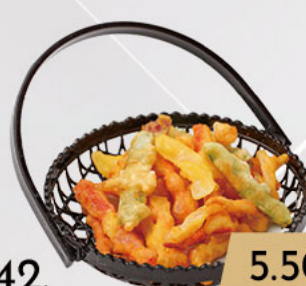
42. 5.50€ TEMPURA DE VERDURAS