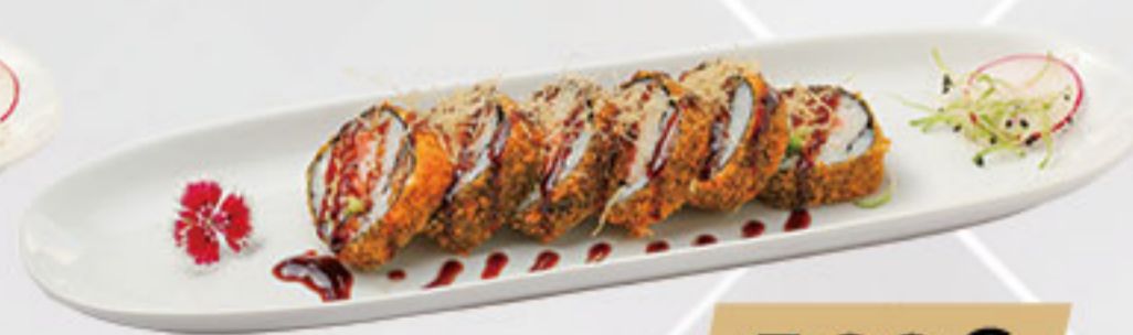
140. 7.00€ LEON TEMPURA (6U)