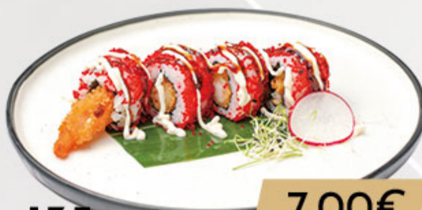
135. 7.00€ DRAGÓN ROJO (8U)