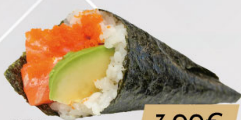
139. 3.00€ TEMAKI SALMÓN (1U)