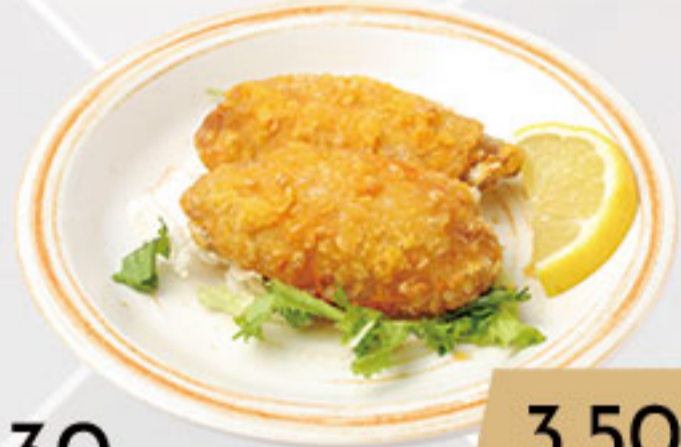
30. 3.50€ ALITAS DE POLLO FRITAS (4U)