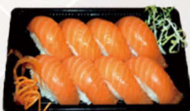
Bento 3 (8U) 12.00€