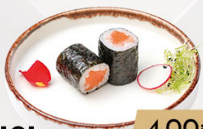
101. 4.00€ MAKI SAKE (8U)