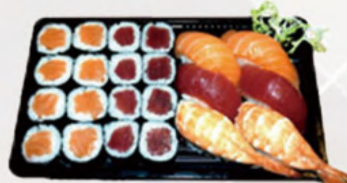
Bento 4 (22U) 14.00€