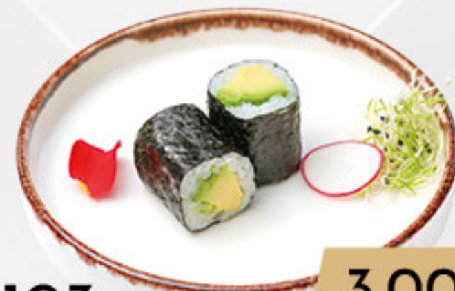
103. 3.00€ MAKI AGUACATE (8U)