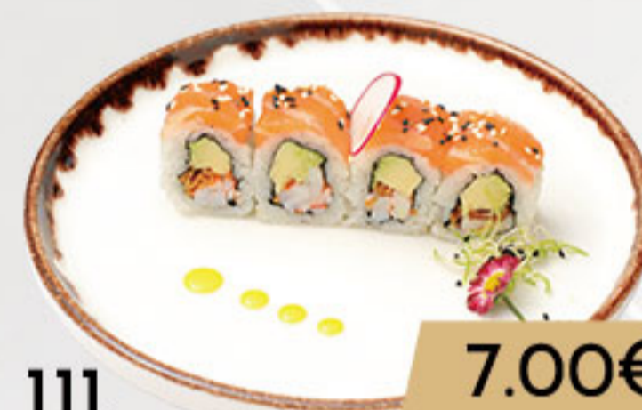
111. 7.00€ KA MAKI (8U)