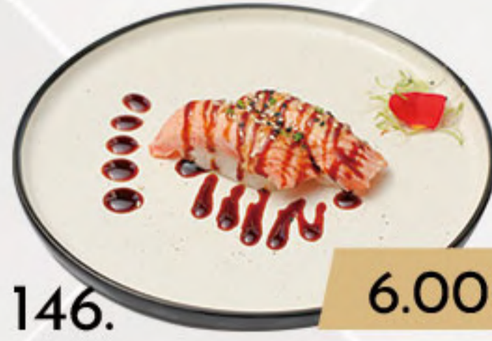
146. 6.00€ SAKE FLAMEADO (4U)