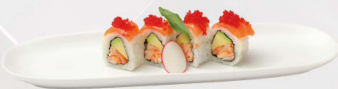
164. 7.00€ OMEGA ROLL (8U)