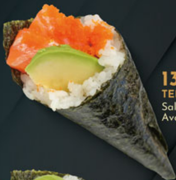
139 ♦ TEMAKI SALMÓN (1U) Salmón aguacate y tobiko Avocado salmon and tobiko