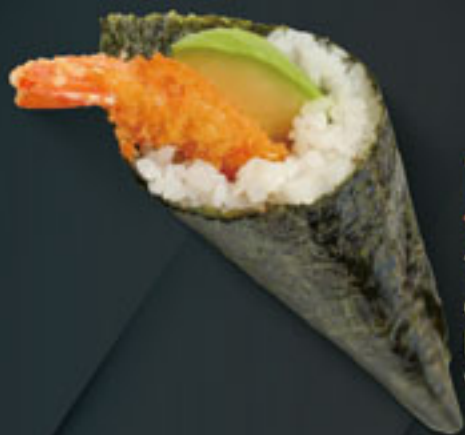
166 ♦♦♦♦♦♦ TEMAKI LANGOSTINO (1U) Tempura de langostino y aguacate con salsa de anguila Prawn and avocado tempura with eel sauce