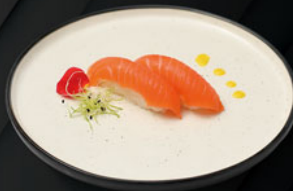
♦ 143 NIGIRI SAKE (2U) Salmón Salmon