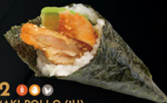
142 ♦♦♦♦ TEMAKI POLLO (1U) Pollo rebozado y aguacate con salsa de anguila Breaded chicken and avocado with eel sauce