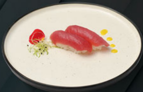
144 ♦ NIGIRI ATÚN (2U) Atún Tuna