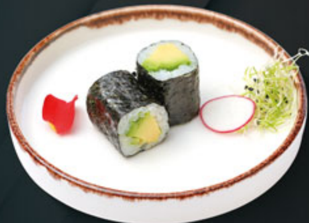
103 MAKI AGUACATE (4U) Aguacate Avocado