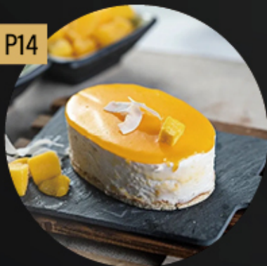
COCO Y MANGO TENTACIÓN HELADA 5.80€