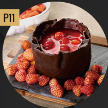
FRESITAS DEL BOSQUE 5.80€