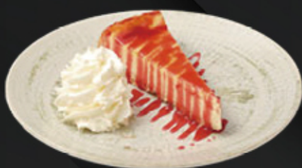
TARTA DE QUESO 2.00€