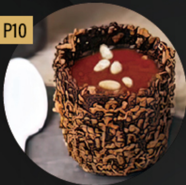
CREMA CATALANA Y PIÑONES 5.80€