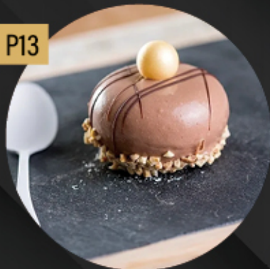
PORCION REDONDA DULCE DE LECHE 5.80€