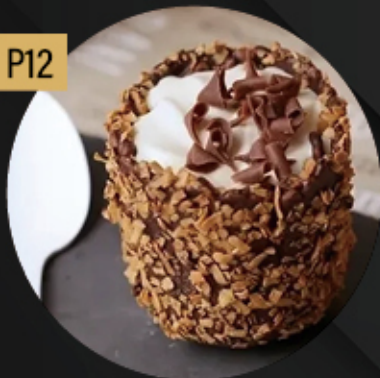
HELADO DE BAILEYS 5.80€