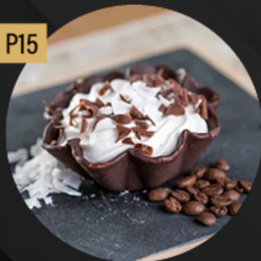
FLOR DE COCO-LOCO (CAFÉ Y COCO) 5.80€