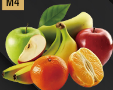
FRUTA NATURAL (1UND) 1.50€