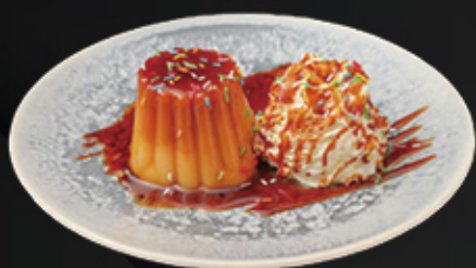
FLAN CON NATA 2.00€