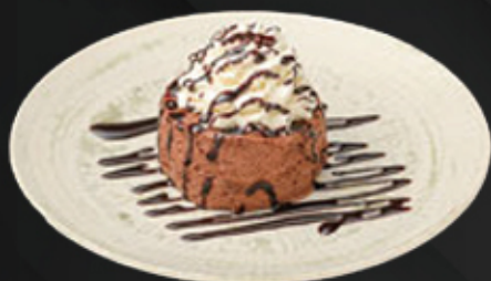
MOUSSE DE CHOCOLATE 2.00€