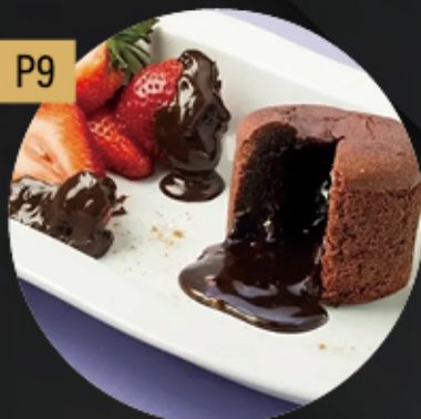
SOUFFLE DE CHOCOLATE 5.80€