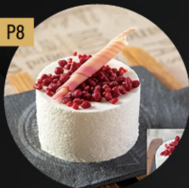
CHOCOLATE BLANCO Y FRUTOS ROJOS (SIN GLUTEN) 5.80€