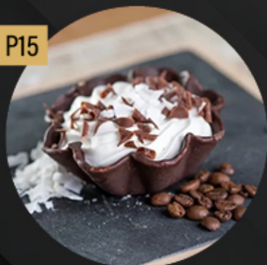
FLOR DE COCO-LOCO (CAFÉ Y COCO) 5.80€